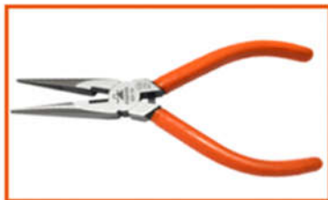
KIM MŨI DÀI