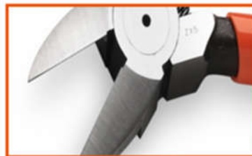
KIM CẮT NHỰA