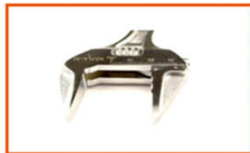
DỤNG CỤ DÁN DỤNG